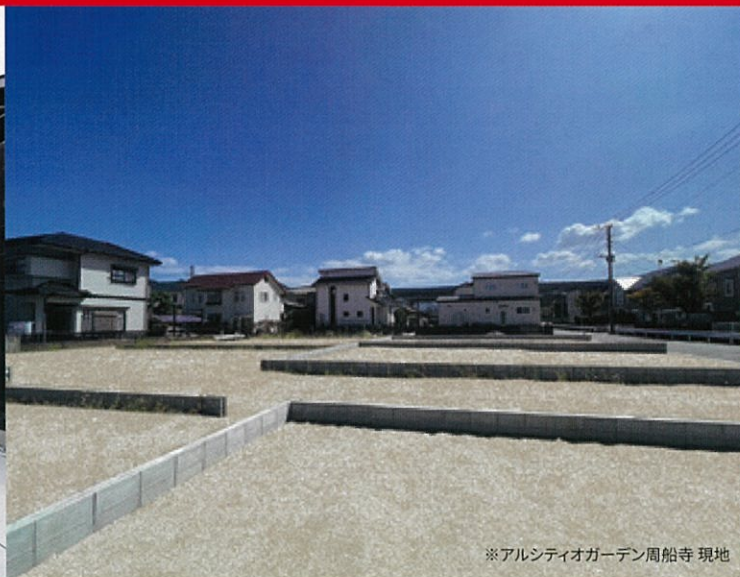
※アルシディオガーデン周船寺 現地